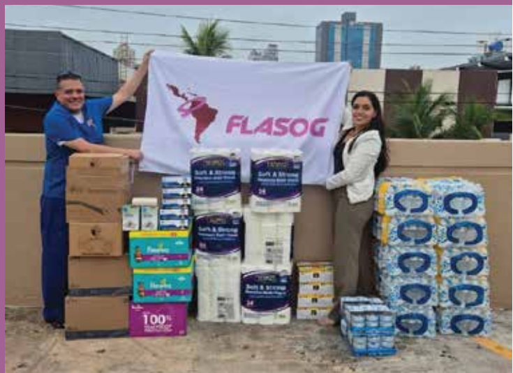
Con donación de insumos médicos y alimentos no perecederos a través de la Cruz Roja