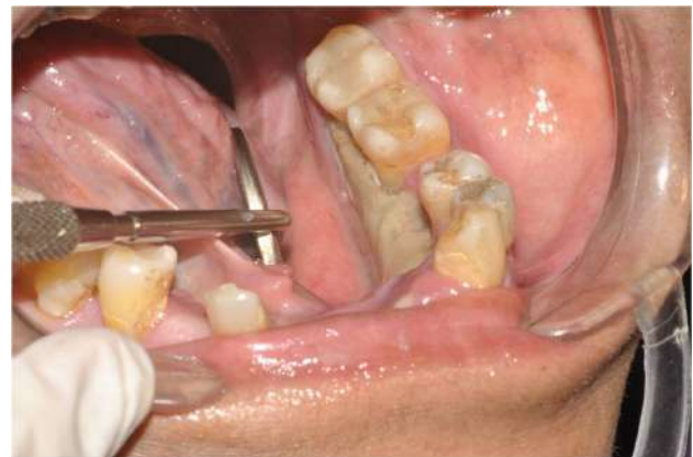
Figura 2. Paciente en tratamiento con BFs, exposición del hueso, ubicación crestal en el maxilar inferior.

La osteonecrosis ocurre cuando los huesos pierden el suministro de sangre y estos mueren observándose una exposición del hueso. Entre los síntomas se destaca el dolor, la inflamación de los tejidos blandos y la movilidad de los dientes por tanto es importante el estar informados del riesgo de esta complicación.