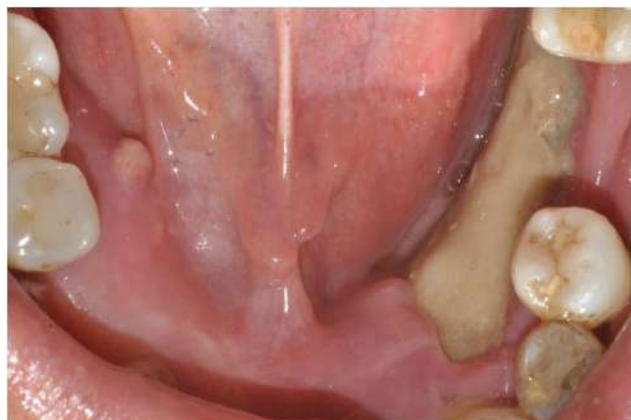
Figura 3. Vista oclusal, exposición del hueso, ubicación crestal en el maxilar inferior.